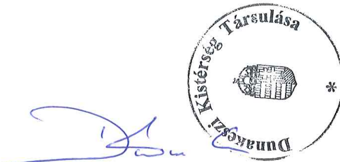
Dióssi Csaba Társulási Tanács Elnöke