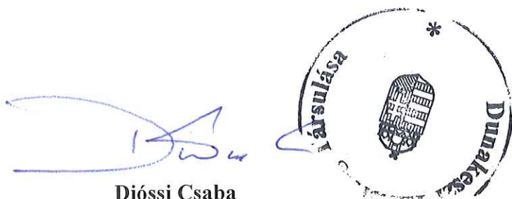
Dióssi Csaba Társulási Tanács Elnöke