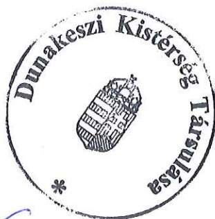
Dióssi Csaba Társulási Tanács Elnöke