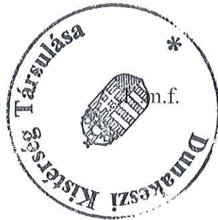
Dióssi Csaba Társulási Tanács Elnöke