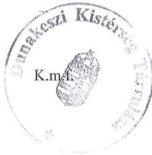
Dióssi Csaba Társulási Tanács Elnöke