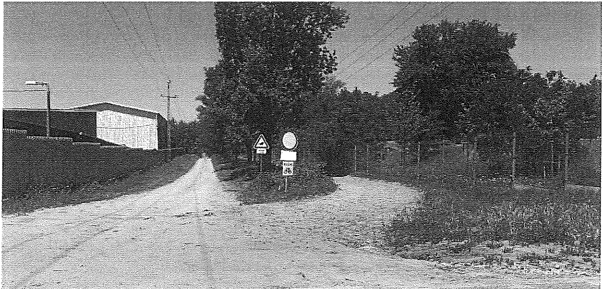
Kápolna utca – Repülőtéri út végénél