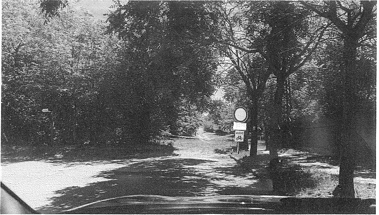
Kápolna utca – Nándor utca végénél